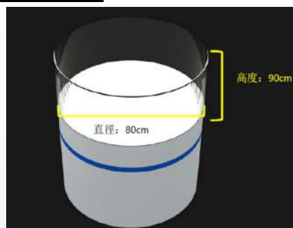
展櫃：白色單層，可放 5 件展品 展品尺寸上限：30 x 30 x 50 (高) cm